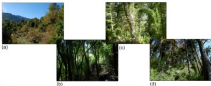
Fig 1. Tipos de bosque considerados en estudio: (a) bosque en permanente intervención, (b) bosque secundario, (c) bosque antiguo de mañío-tepa y (d) bosque antiguo de araucaria.