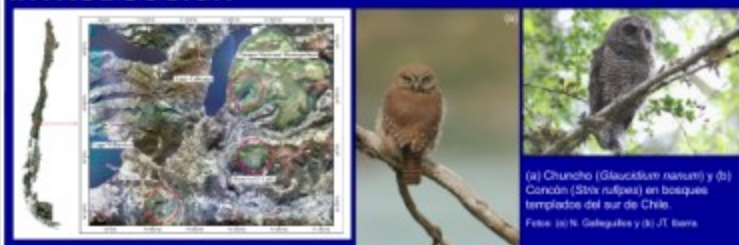
(a) Chuncho ( Glaucidium nanum ) y (b) Concón ( Strix rufipes ) en bosques templados del sur de Chile.